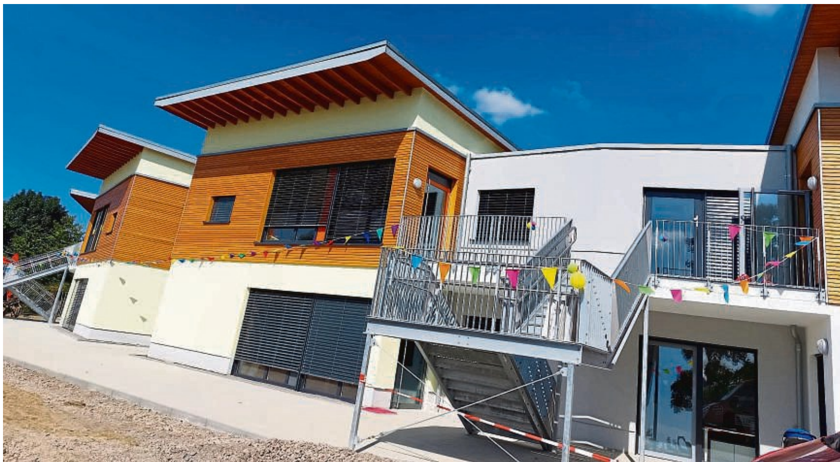
Die Kita „Farbenspiel“ ist seit Montag an ihrem neuen Standort an der Birkeshöh in Betrieb.